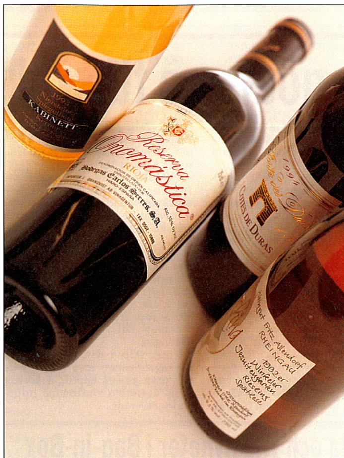
Fyra utvalda viner från Granqvist på Systembolaget: Nr 82950 Niersteiner Spiegelberg Kabinett, Nr 2605 Carlos Serres Reserva Onomastica, Nr 2180 Porte des Ducs och Nr 6232 Winkeler Jesuitengarten Riesling Spätlese.

Weingut Allendorf är ett anrikt familjeföretag. Redan i början av 1200-talet kom den förste Allendorf till Rheingau.