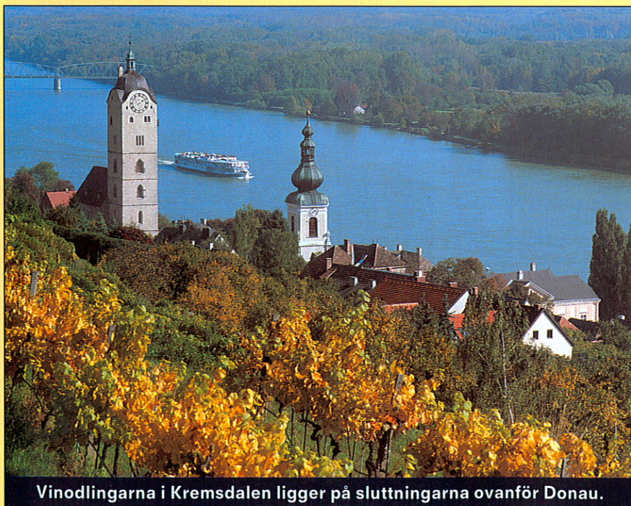
Vinodlingarna i Kremsdalen ligger på sluttningarna ovanför Donau.